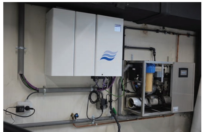
▲ De Centrale Unit van het Condair HumiLife systeem geïnstalleerd in de serviceruimte van het pand.

Dat zie je terug in het pand. Bijvoorbeeld aan de implementatie van voicecontrol gestuurde schuifdeuren en andere technische vernieuwingen. Maar ook het gevoel en de ervaring is erg belangrijk. Ideeën zoals levend mos op de muren dragen hier aan bij. Het is van belang dat de medewerkers zich goed voelen in hun werkomgeving. Dat zie je aan de gebruikte materialen, mooie afwerkingen en een bar om te ontspannen.