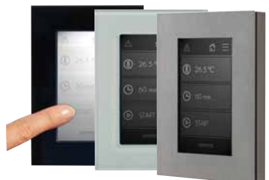
Het externe scherm in drie versies

De slim ontworpen magnetische frameconstructie stelt stoombadbouwers echter ook in staat om de armatuur te individualiseren met een materiaal naar wens van de klant.